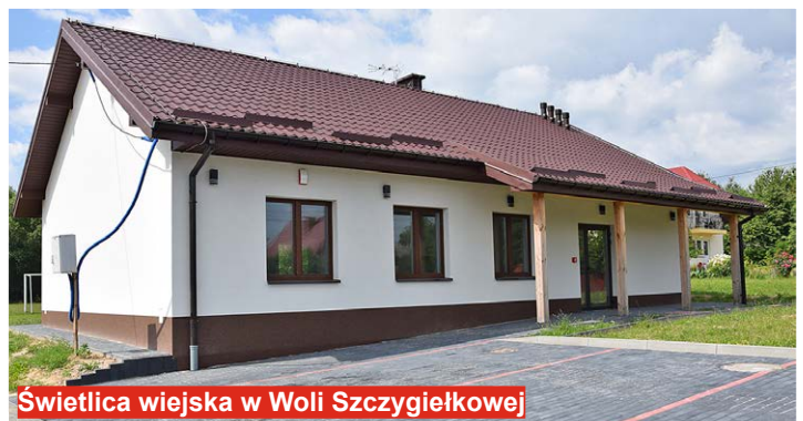
Świetlica wiejska w Woli Szczygielkowej