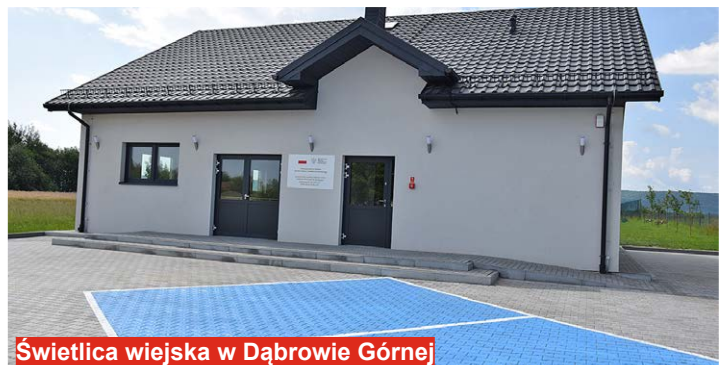
Świetlica wiejska w Dąbrowie Górnej