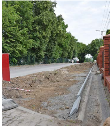
Budowa chodnika przy ul. Wolności w Bodzentynie

Warto nadmienić, iż mieszkańcy Woli Szczygielkowej już od kilku lat zgodnie przeznaczali środki z funduszu sołectkiego na realizację tej inwestycji, co tylko podkreśla fakt, jak ważne jest powstanie takiego miejsca w ich sołectwie. Szczególnie zaangażowani w powstanie świetlicy są członkowie Stowarzyszenia Wolanie spod Łysicy, ponieważ dla ich dalszego rozwoju kluczowe jest stworzenie miejsca, w którym będą mogli spotykać się na próby swojego zespołu folklorystycznego. Świetlica w przyszłości będzie mogła także pełnić funkcję stołówki dla dzieci uczęszczających do Szkoły Podstawowej w Woli Szczygielkowej, ponieważ obiekt budowany jest na sąsiedniej działce. W nowym budynku znajduje się kuchnia,