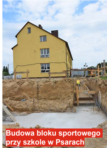
Budowa bloku sportowego przy szkole w Psarach

łazienka oraz przestronna sala, w której w niedalekiej już przyszłości będą mogły odbywać się spotkania mieszkańców.