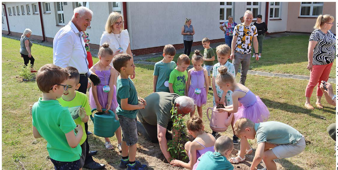
Zdjęcia Urząd Marszałkowski Województwa Świętokrzyskiego